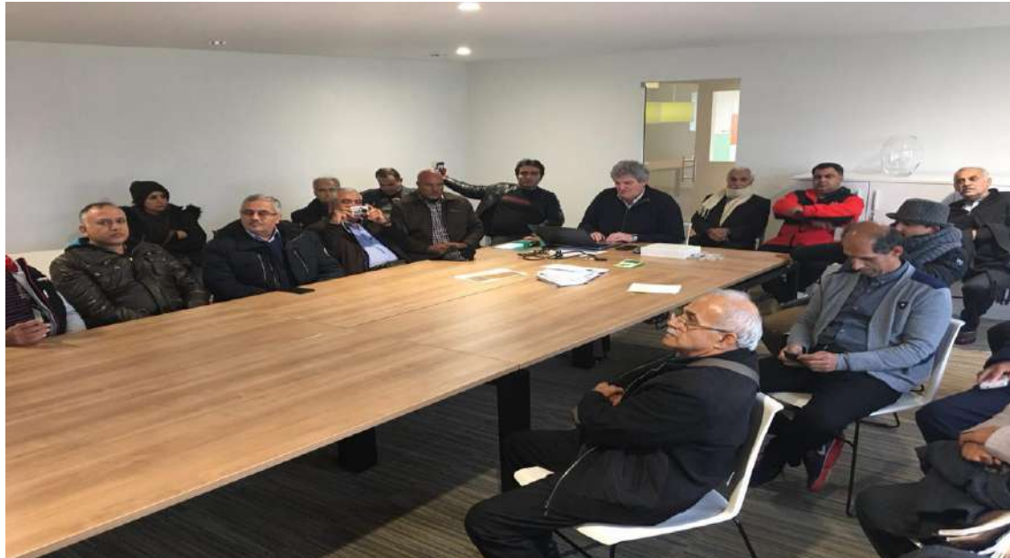
بازدید از تجهیزات شرکت و جلسه پرسش پاسخ با مدیر شرکت (TGS)

پژواک پژوهش ایده کاوش (سهامی خاص) PEZHVAC Research & Innovation Co.