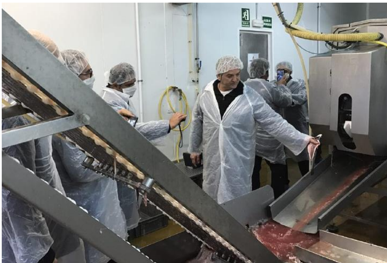
بازدید از مرکز بسته بندی و فرآوری شرکت Truchadelsegre ، شهر ال لیدا- اسپانیا- ۹۵/۱۲/۴