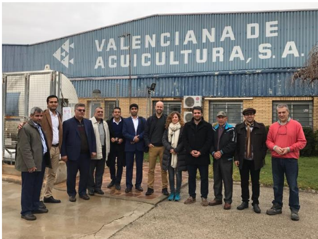
بازدید از مزرعه پرورش ماهی در سیستم مدار بسته شرکت Valaqua ، شهر والنسیا- اسپانیا ۹۵/۱۲/۶