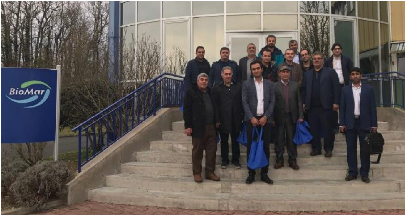
بازدید از شرکت Biomar تولید کننده خوراک آبزیان ، شهر نرساک- فرانسه - ۹۵/۱۲/۲