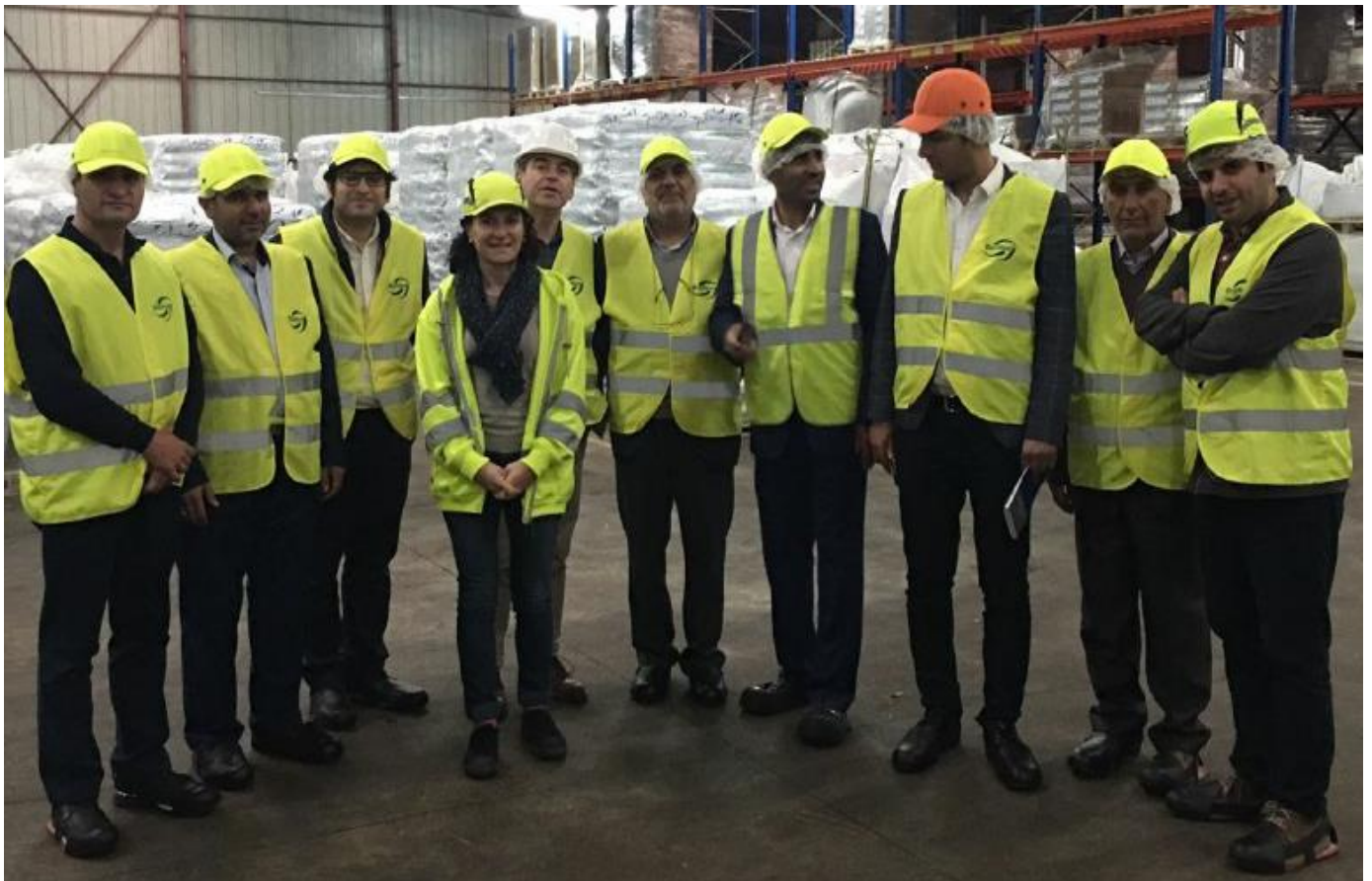
بازدید از کارخانه و خط تولید شرکت Biomar ، شهر نرساک- فرانسه - ۹۵/۱۲/۲