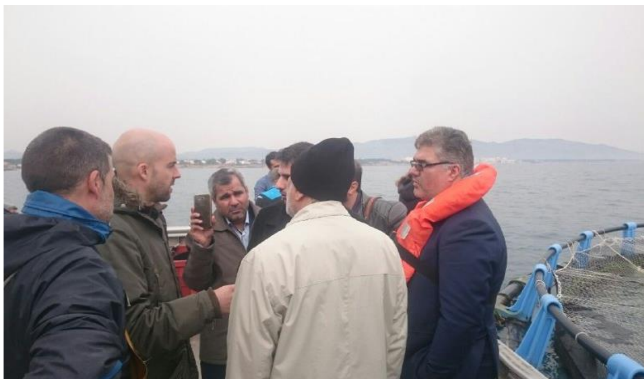
بازدید از مرکز پرورش ماهی در قفس شرکت Invermar ، شهر تاراگونا- اسپانیا- ۹۵/۱۲/۵