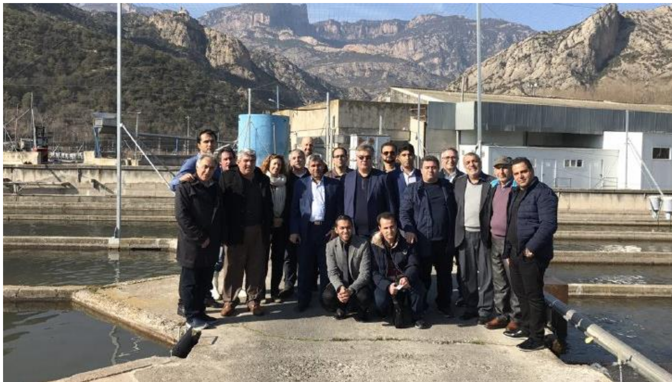
بازدید از مزرعه پرورش قزل آلائی شرکت Truchadelsegre ، شهر ال لیدا- اسپانیا- ۹۵/۱۲/۴