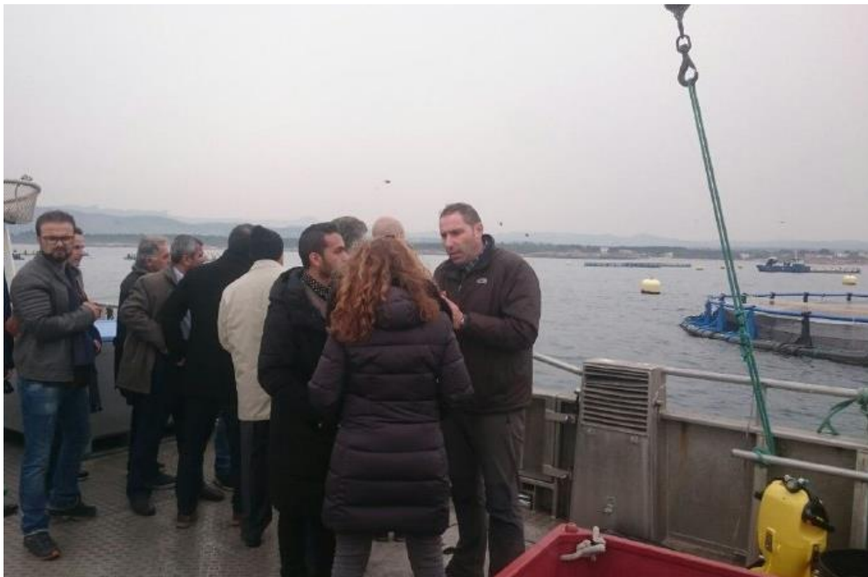
بازدید از مرکز پرورش ماهی در قفس شرکت Invermar ، شهر تاراگونا- اسپانیا- ۹۵/۱۲/۵