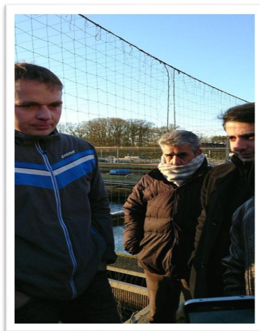
برگزاری جلسات پرسش و پاسخ در مزارع پرورش قزل آلا شرکت آکواکلچر فیشتکنیک، هانوفر- آلمان