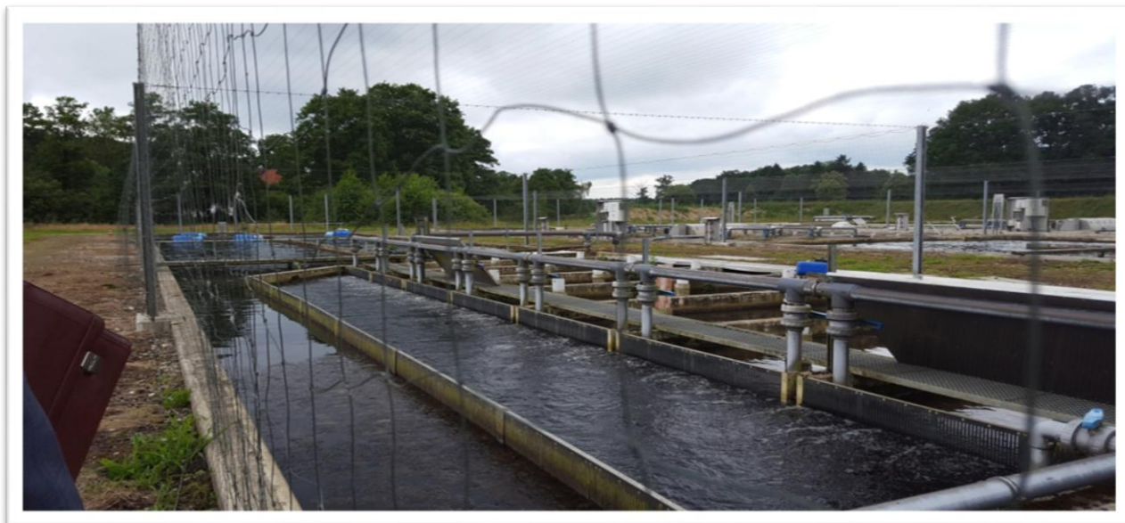
بازدید از مزارع پرورش ماهی قزل آلا شرکت آکواکلچر فیشتکنیک و سیستم های چرخش آب، هانوفر- آلمان