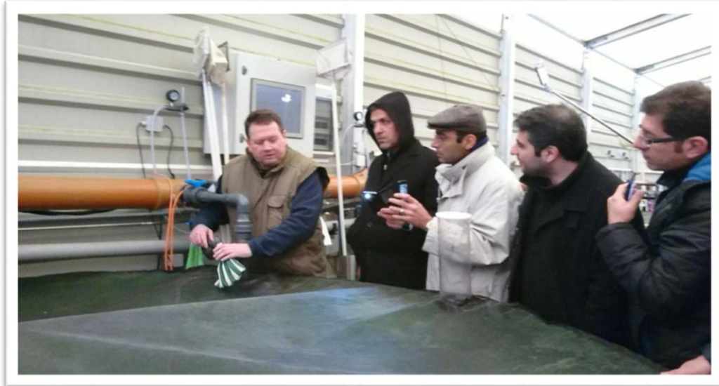
ارائه توضیحات میدانی در خصوص تجهیزات پیشرفته آبی پروری شرکت آکوافیوچر، هاگن، آلمان