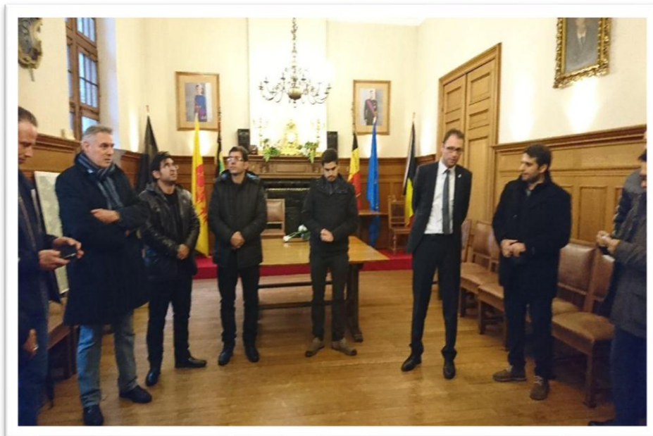
ارایه توضیحات میدانی پیش از ورود به مزارع متونت گابریل پرورش ماهی، مالمدی-بلژیک