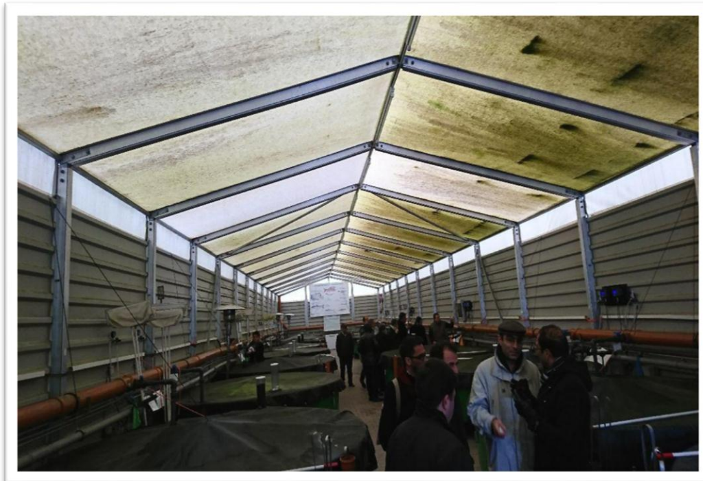
برگزاری جلسات پرسش و پاسخ در مراکز آبی پروری شرکت آکوافیوچر، هاگن، آلمان