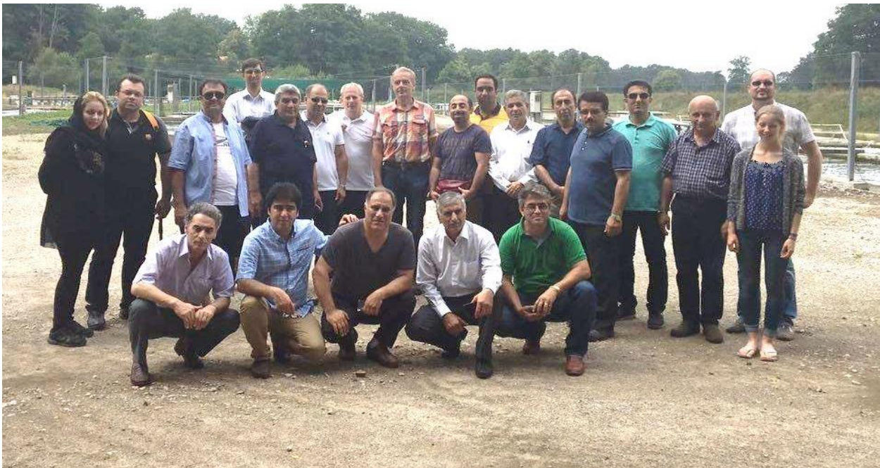
بازدید از بزرگترین مزرعه قزل آلی شمال آلمان، شرکت آکواکلچر فیشتکنیک، شهر ویتزندورف، آلمان