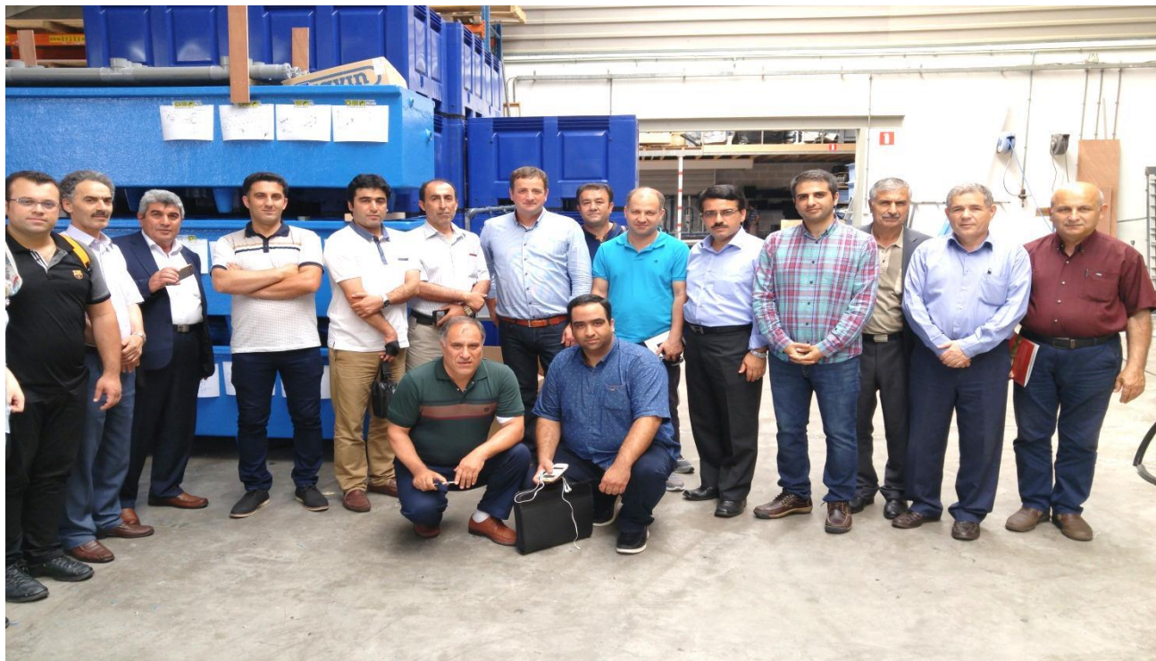
بازدید از شرکت فلنور اند نویجن، شهر آیندهوون، هلند