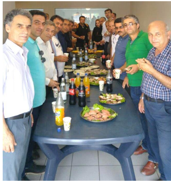
بازدید از بزرگترین مزرعه قزل آلی شمال آلمان، شرکت آکواکلچر فیشتکنیک، شهر ویتزندورف، آلمان