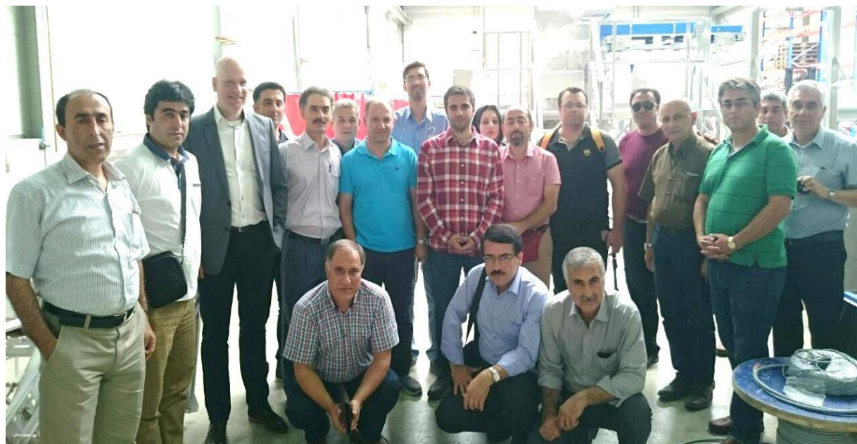
بازدید از شرکت اینوتک سیستمز، شهر ورکندام، هلند