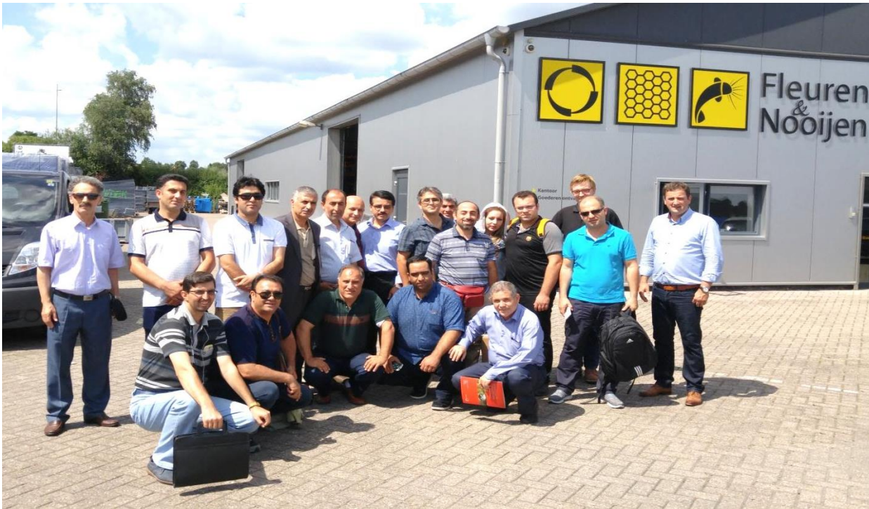
بازدید از شرکت فلئورن اند نويجن، شهر آيندهوون، هلند