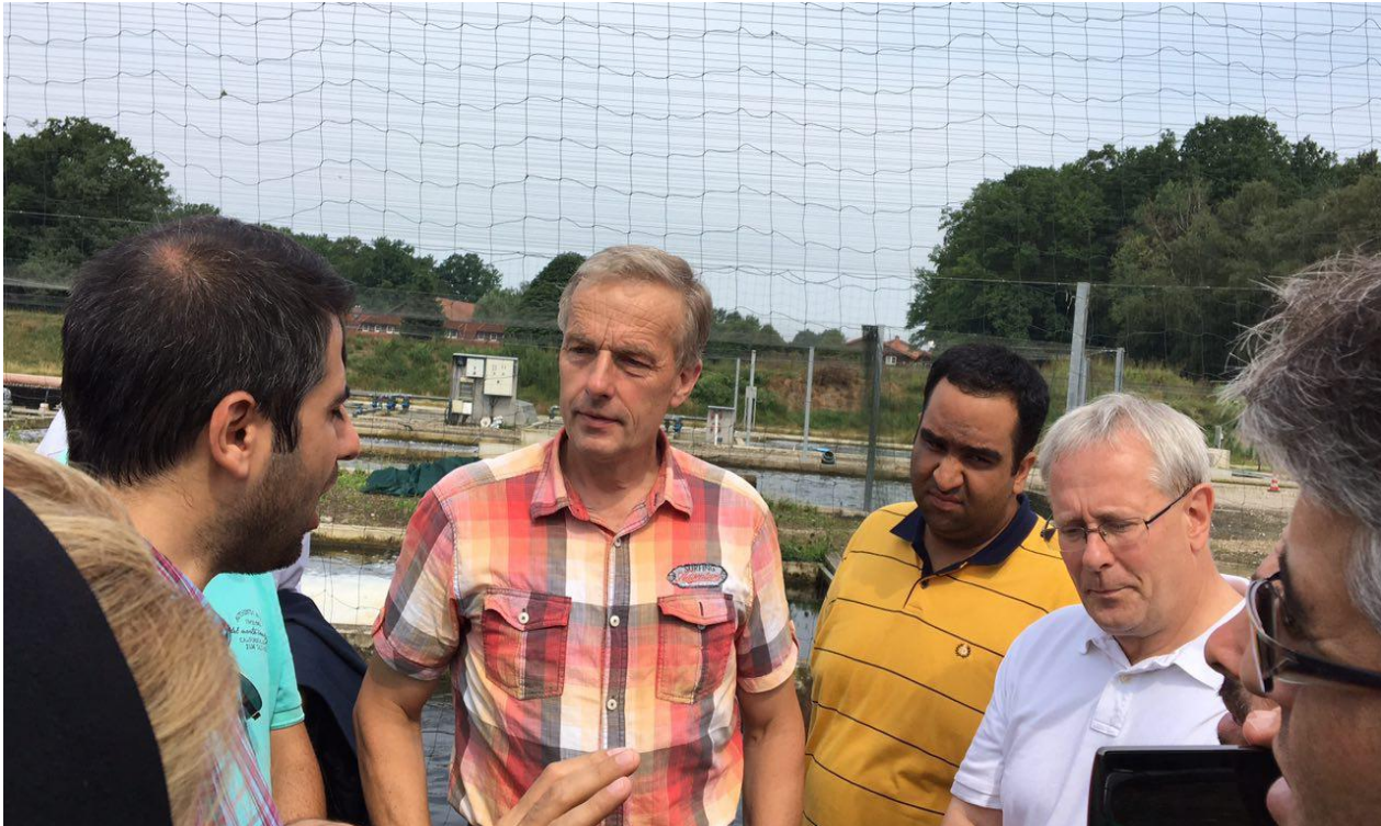
بازدید از بزرگترین مزرعه قزل آلی شمال آلمان، شرکت آکواکلچر فیشتکنیک، شهر ویتزندورف، آلمان