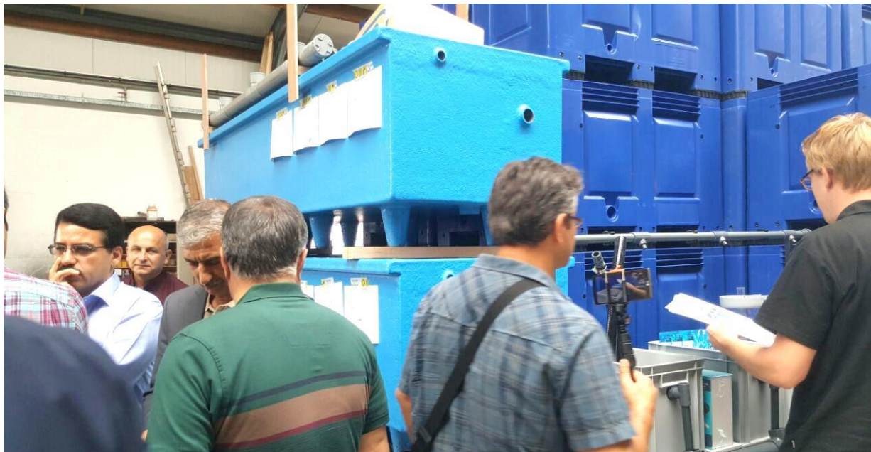
بازدید از شرکت فلئورن اند نويجن، شهر آيندهوون، هلند