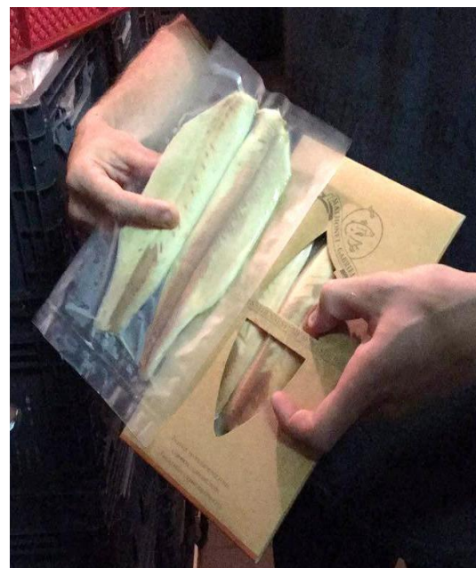
بازدید از تجهیزات تولیدی شرکت متونت-گابریل، مالمدی، بلژیک