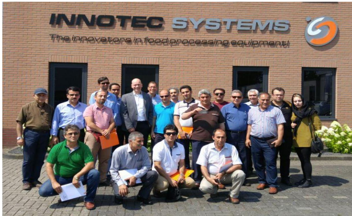
بازدید از شرکت اینوتک سیستمز، شهر ورکندام، هلند