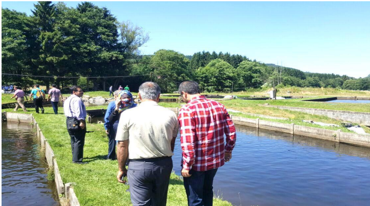
بازدید از روشهای اجرایی در مزرعه متونت-گابریل، مالمدی، بلژیک