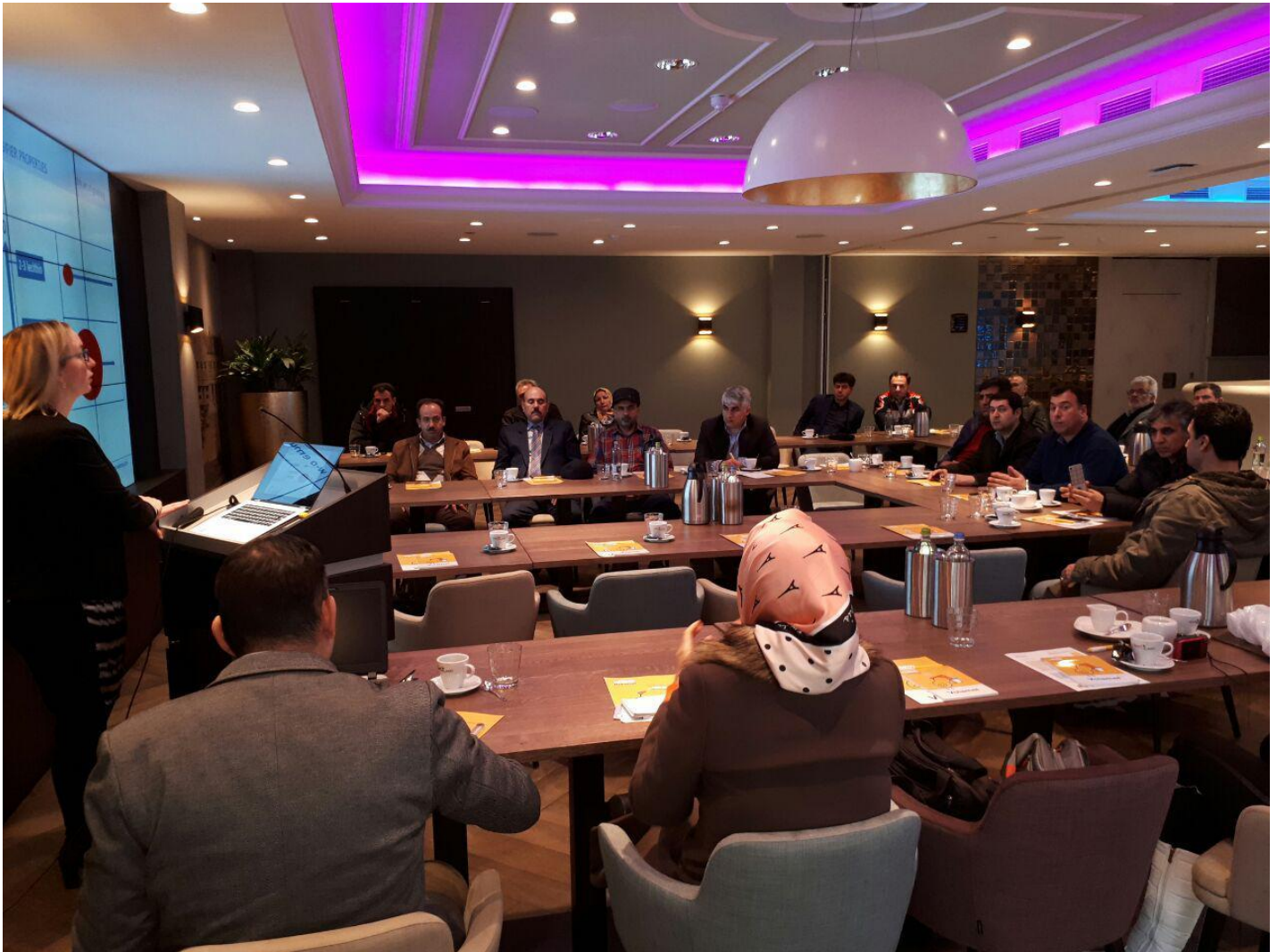
جلسه ارائه و پرسش و پاسخ شرکت Nukamel شهر ویرت، هلند - پنجشنبه ۹۵/۱۱/۲۸