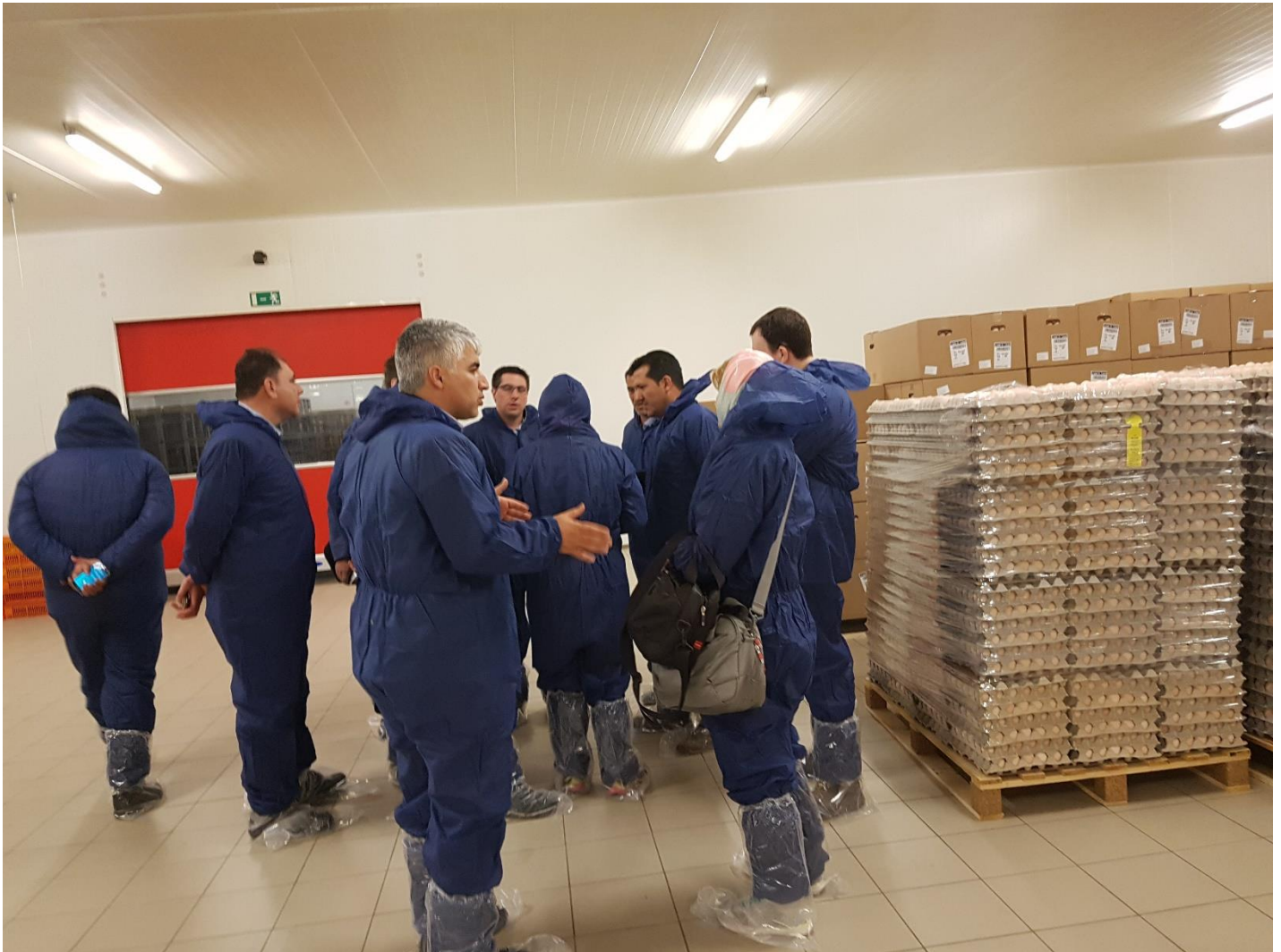
بازدید از هجری شرکت Belgabroed شهر مرکسپلاس، بلژیک - چهارشنبه ۹۵/۱۱/۲۷