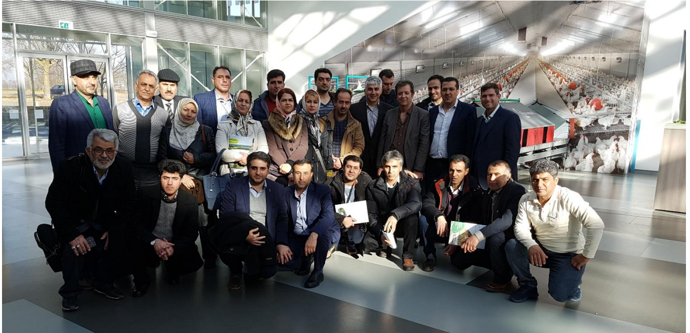
بازدید از شرکت Vencomaticgroup شهر ایرسل، هلند - سه شنبه ۹۵/۱۱/۲۶