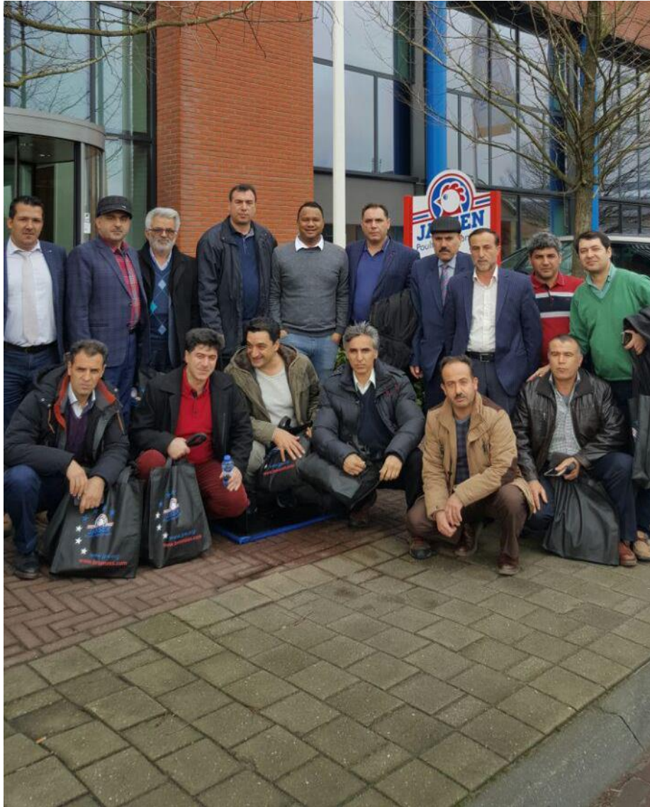
بازدید از شرکت تولید تجهیزات شرکت Jonsen poultry equipment شهر بارنه فلد، هلند - جمعه ۹۵/۱۱/۳۰