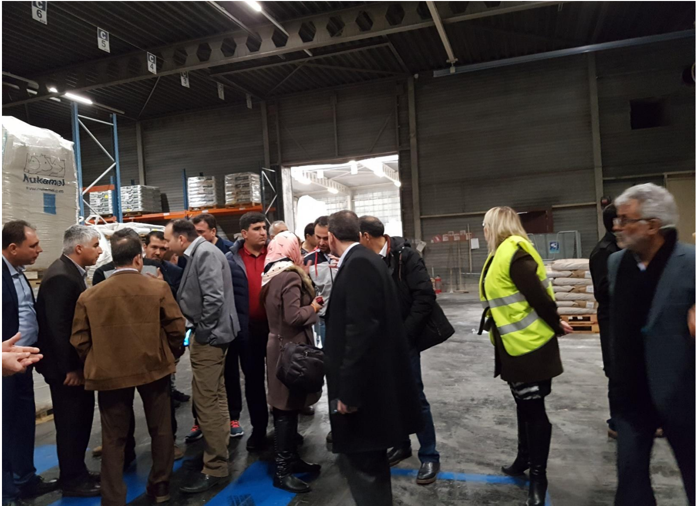
بازدید از خط تولید امولسیفایر شرکت Nukamel شهر ویرت، هلند - پنجشنبه ۹۵/۱۱/۲۸