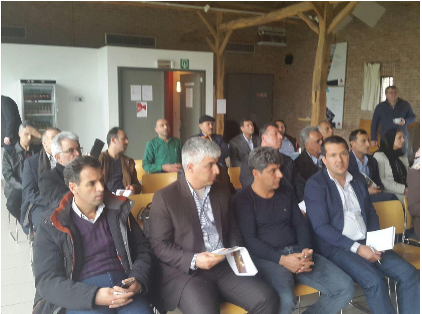
جلسه ارائه و پرسش و پاسخ در مرکز تحقیقاتی مرغداری (provincieantwerpen) شهر آنتورپن، بلژیک - چهارشنبه ۹۵/۱۱/۲۷