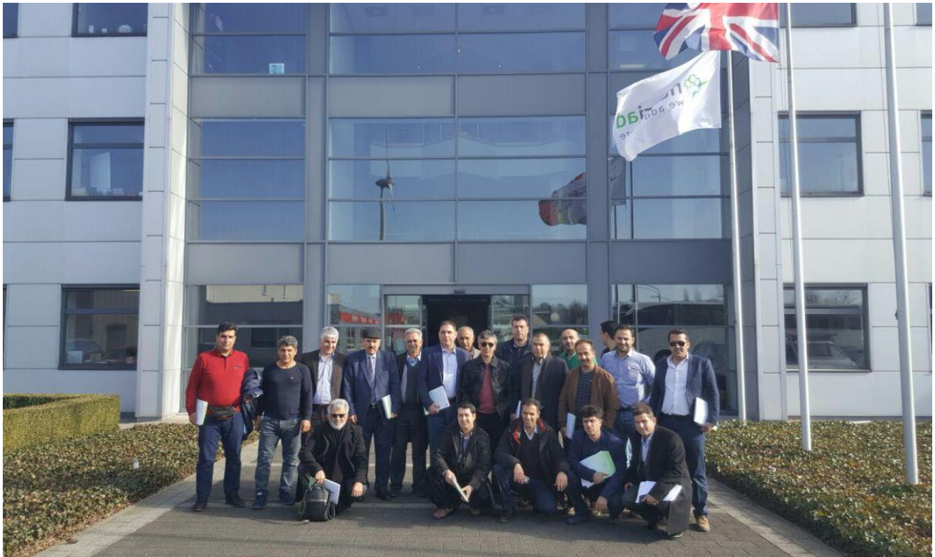
بازدید از کارخانه تولید خوراک INVE België شهر دندرموند، بلژیک - چهارشنبه ۹۵/۱۱/۲۷