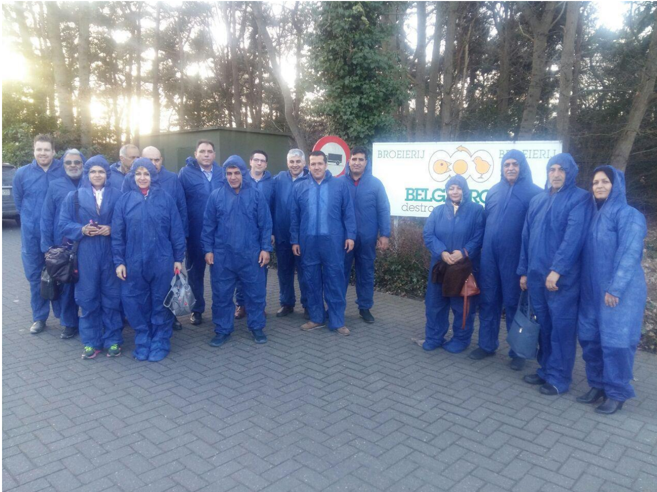
بازدید از هچری شرکت Belgabroed شهر مرکسپلاس، بلژیک - چهارشنبه ۹۵/۱۱/۲۷