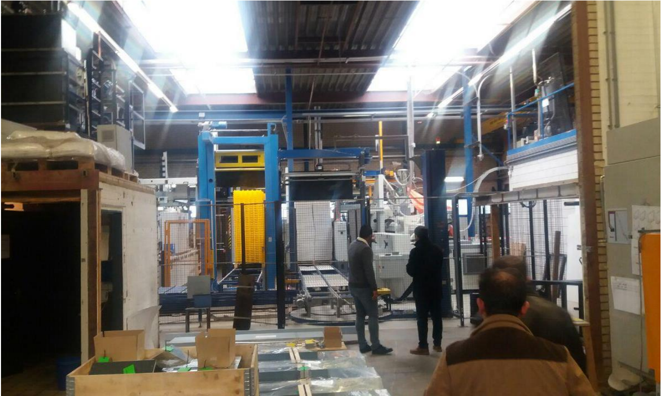
بازدید از سایت تولید تجهیزات شرکت Jonsen poultry equipment شهر بارنه فلد، هلند - جمعه ۹۵/۱۱/۳۰