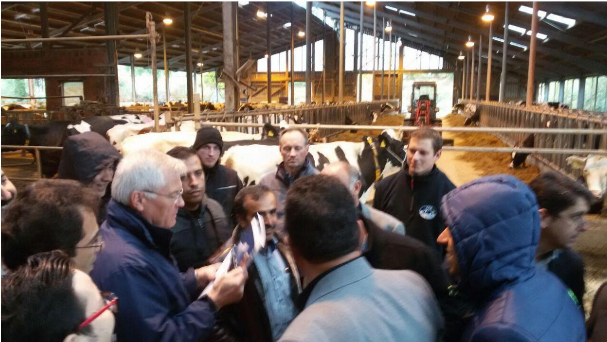
بازدید از فارم پرورش و اصلاح نژاد گاو هلشتاین در حومه آسفلد به همراه ارائه توضیحات میدانی