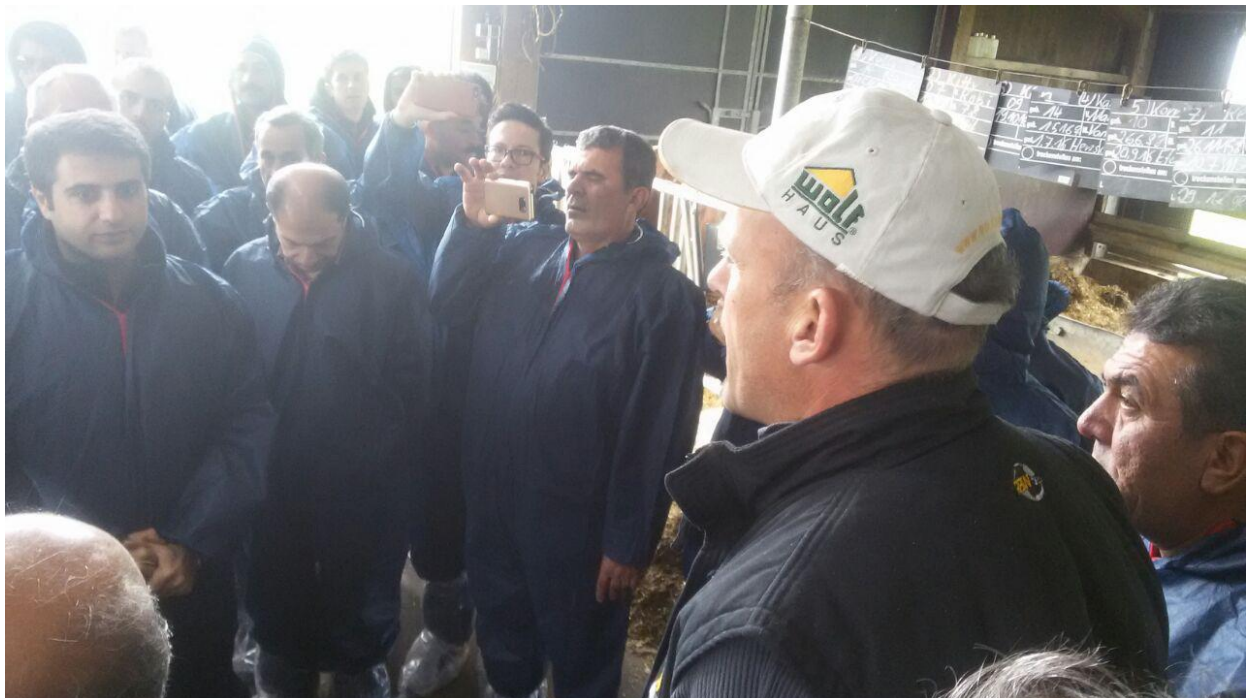
ارائه توضیحات اولیه پیش از بازدید در خصوص فارم پرورش و اصلاح نژاد گاو سیمنتال در هربرتینگن