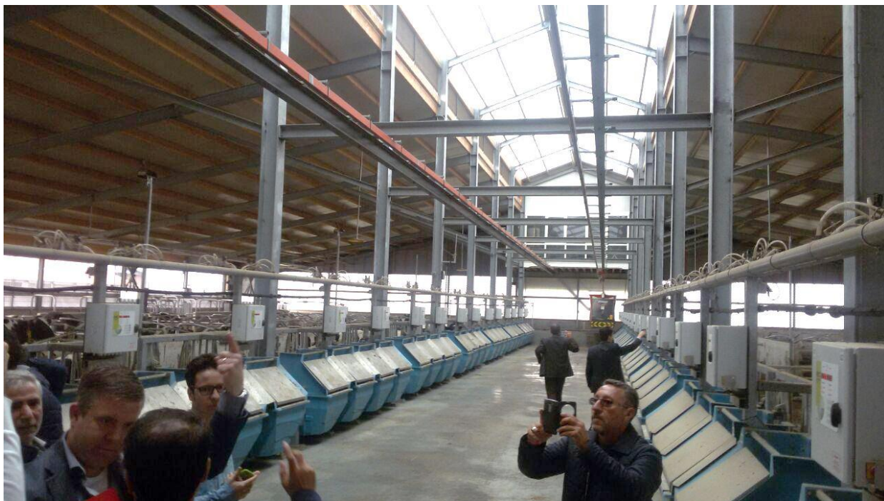
بازدید از فارم تحقیقاتی مرکز لبنیات هلند