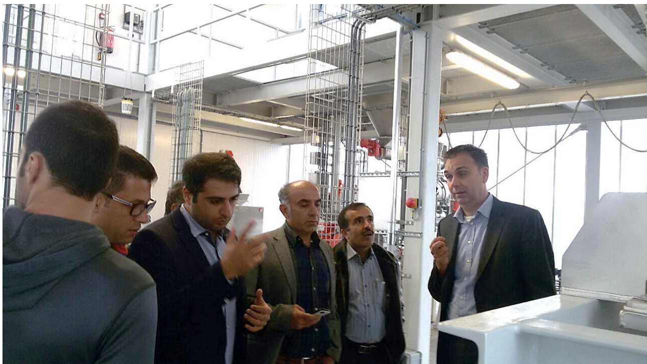
بازدید میدانی از تجهیزات تولیدی شرکت دینیسن بی وی در زمینه اختلاط خوراک دام