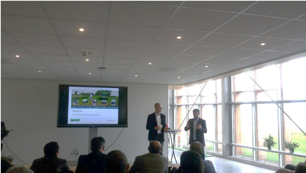
حضور در ارائه‌های مختصر دوازده شرکت در مرکز لینیات هلند