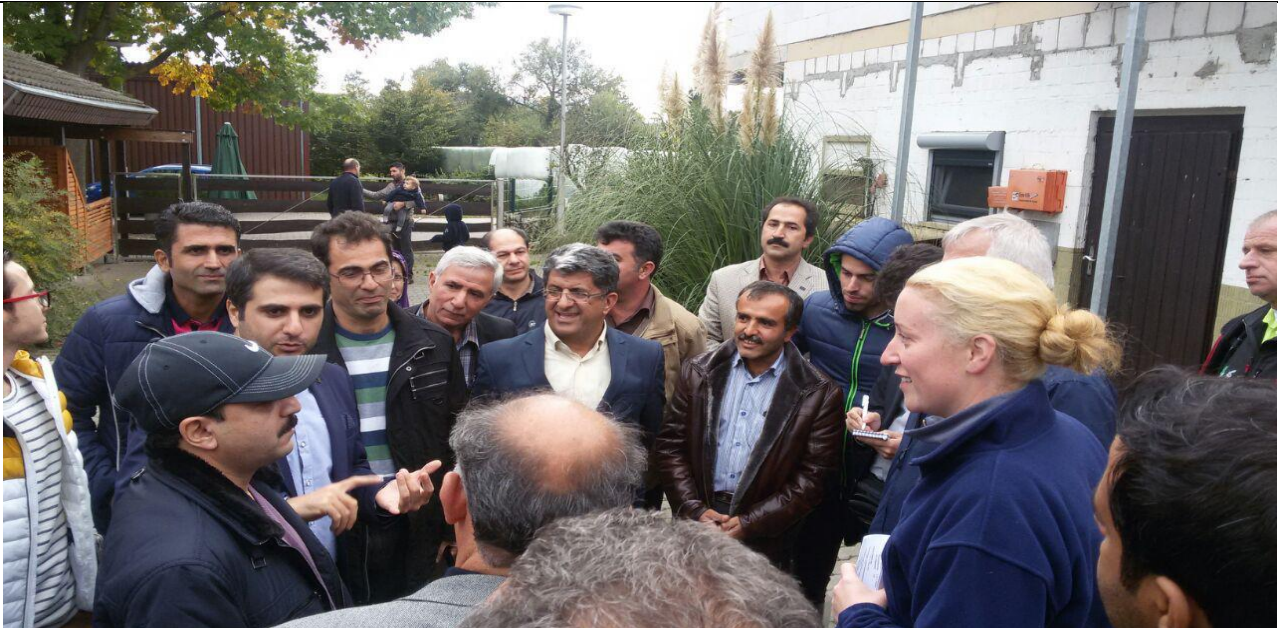
ارائه توضیحات میدانی در فارم پرورش و اصلاح نژاد گاو هلشتاین در آسفلد