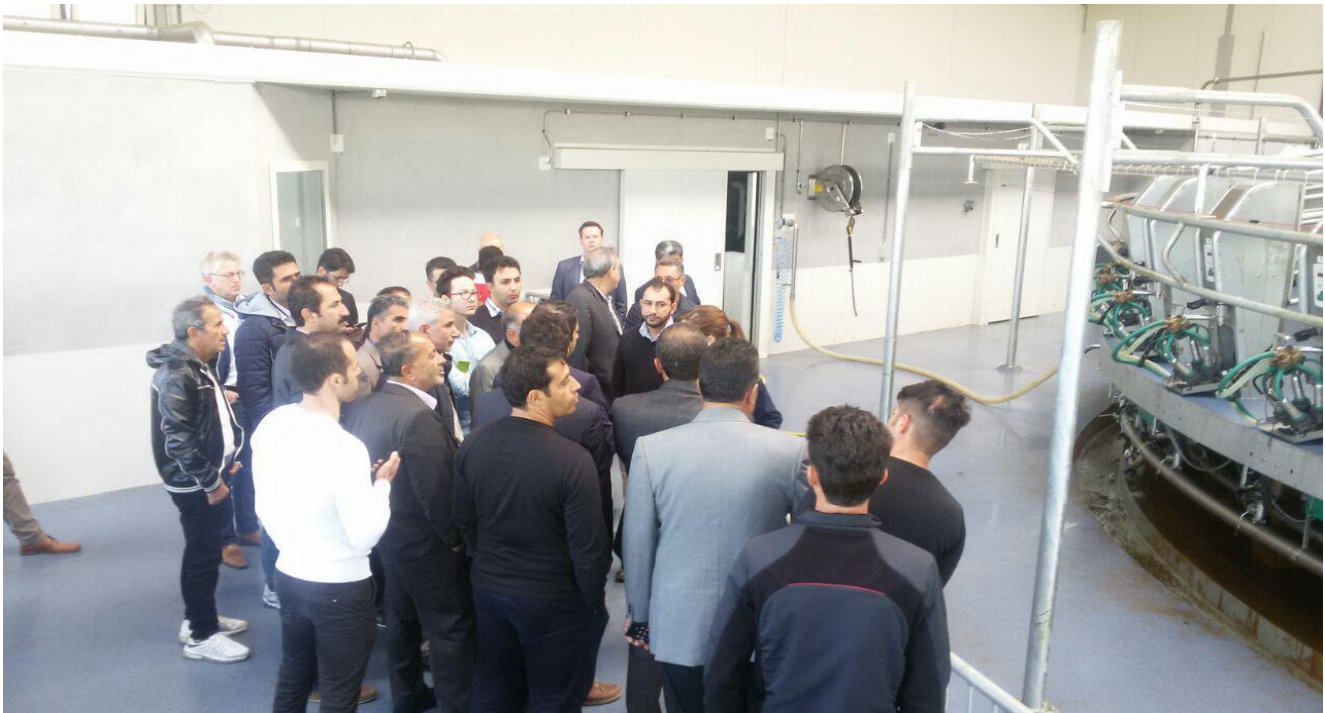
بازدید میدانی از تجهیزات تولید شده توسط شرکت دلتا اینترسومنتس به همراه پرسش و پاسخ و ارائه توضیحات