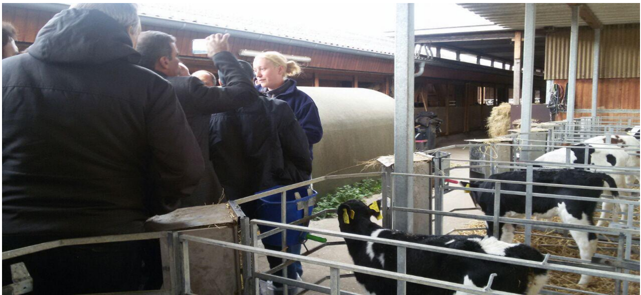
بازدید از فارم اصلاح نژاد گاو هلشتاین در آسفلد