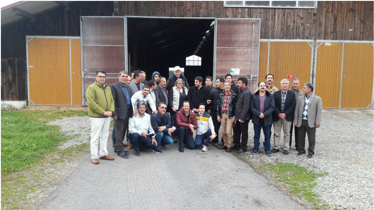
بازدید از فارم پرورش و اصلاح نژاد گاو سیمنتال در وربرتینگن