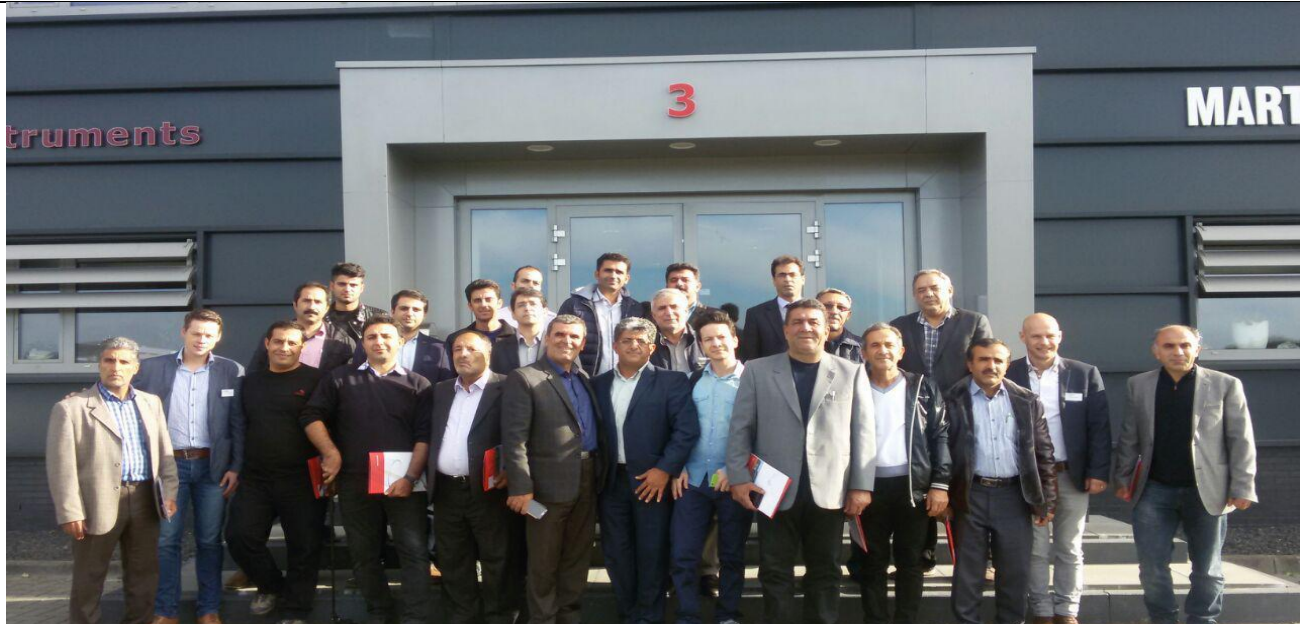
بازدید از شرکت دلتا اینترسومنتس