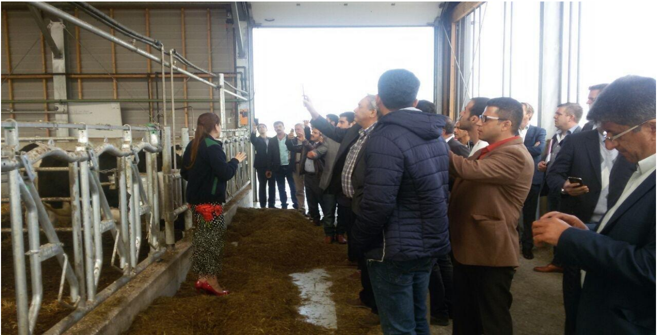
بازدید از فارم شرکت دلتا اینسترومنتس به همراه ارائه توضیحات و پاسخگویی به سوالات