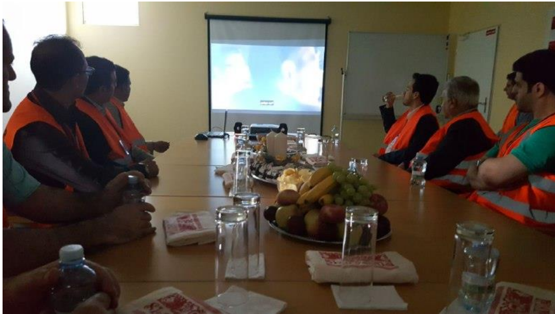
معرفی گروه دنفوس و شرکت دنفوس اسلواکی به همراه فیلم معرفی شرکت