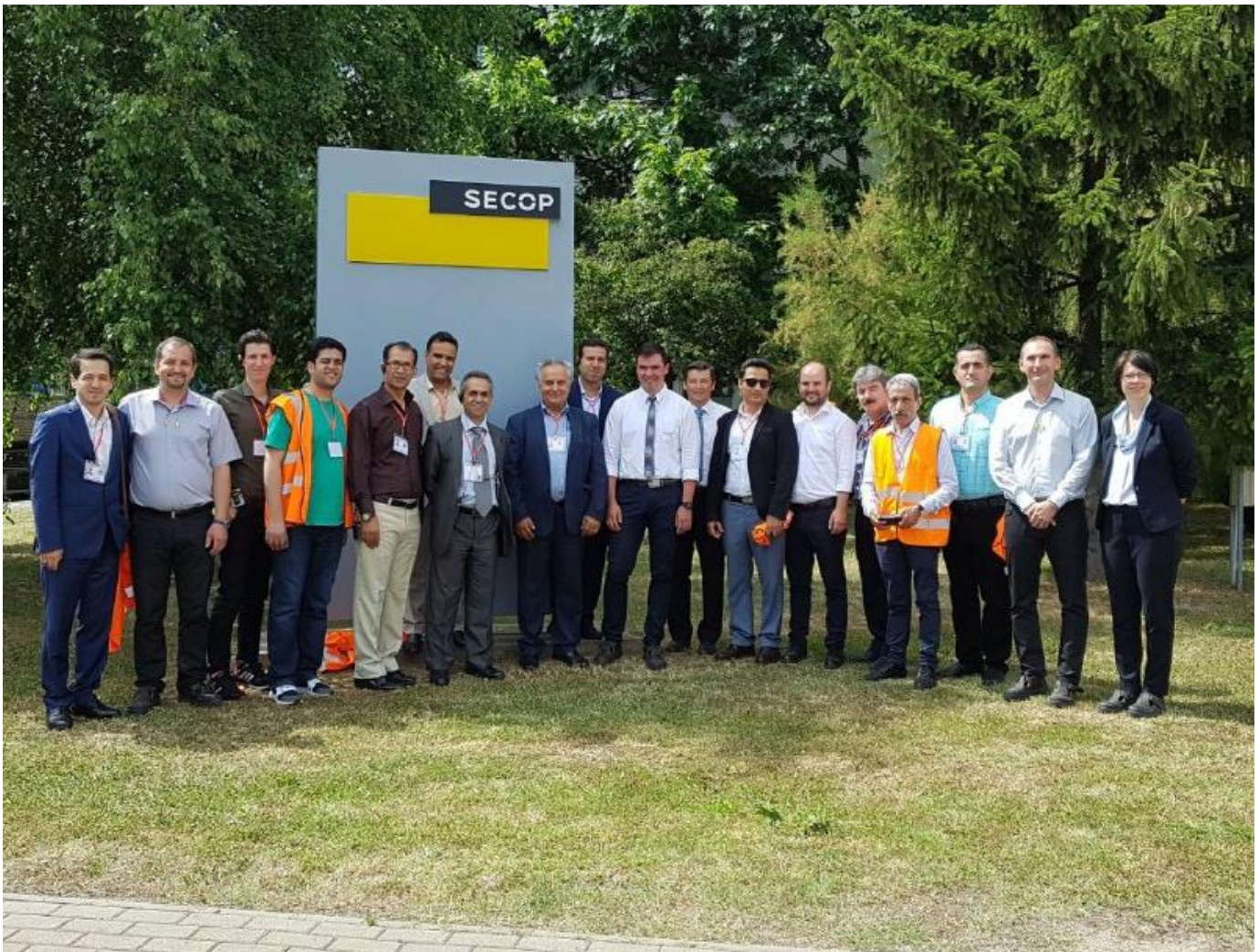
بازدید از شرکت سکاپ، تولید کننده کمپرسور و کندانسور، شهر زاته موراته کشور اسلواکی