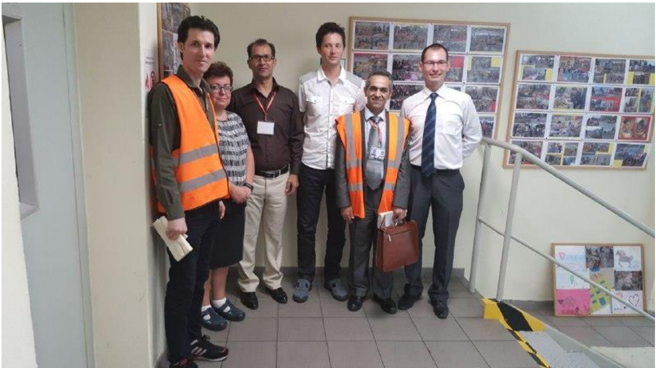
بازدید از محل و تولیدات شرکت ترموستات دنفوس