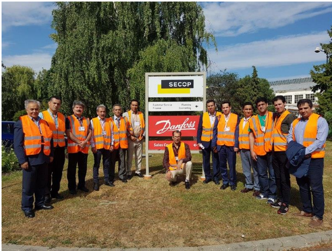
بازدید از شرکت Danfoss Thermostat تولید کننده ترموستات، شهر زاته موراته کشور اسلواکی