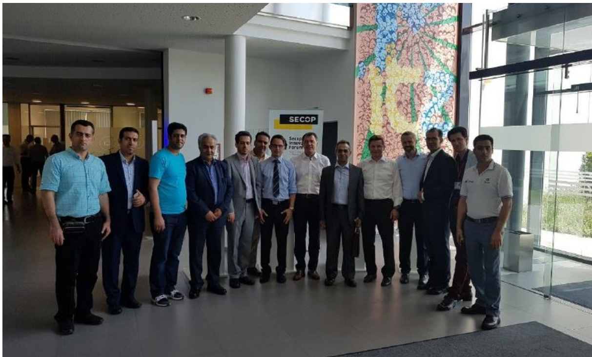
بازدید از شرکت سکاپ در شهر فرستنفد کشور اتریش