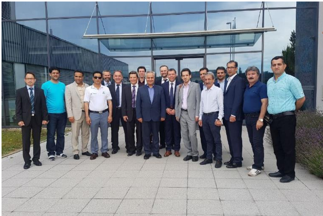
بازدید از شرکت سکاپ در شهر فرستند کشور اتریش