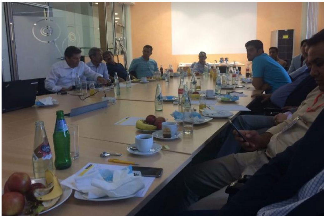
معرفی شرکت سکاپ در کشور اتریش، خط مشی آتی شرکت و جلسه پرسش و پاسخ