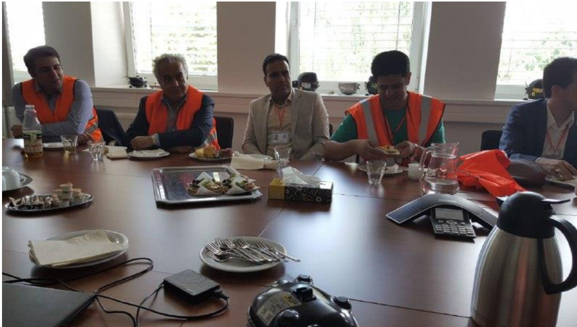
معرفی شرکت سکاپ و واحد این شرکت در اسلواکی به همراه پذیرایی از مهمانان