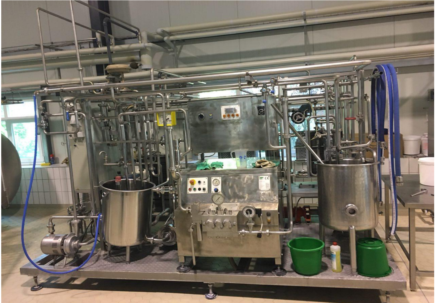
دستگاه تصفیه اولیه شیر دام